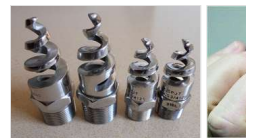
雾化喷头喷嘴带效果图