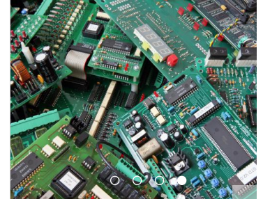
买电子元件去哪个网站

圆桌对话主要围绕三大主题，就关于全球哪些投资区域成为新热点、中外关系和地缘性因素释放出来的信号以及中国推进高水平对外开放为跨国企业带来的新机遇和挑战进行了讨论，对话嘉宾对全球投资格局及中国在其中扮演的重要角色发表了真知灼见，到场来宾对现有金融环境下产生的影响和多元化投资都接收到了全新视角的理解。