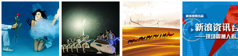
冰火至尊轻变精品裁决 精彩生活快来看 手机电子书免费下载