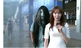
镇定的美女主持人，专业形象令人赞赏！