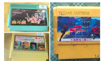
70、80后应该都认得这种卡片，种类越少越好玩！