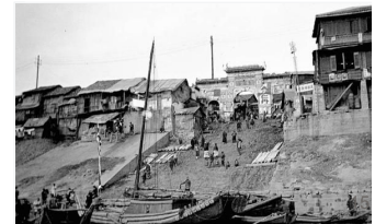
老照片：辛亥革命后的江城武汉