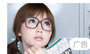
恨不在上海！11月起，上班族可正式申读1...