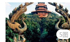
武汉最有名的几座山，你爬过几座？